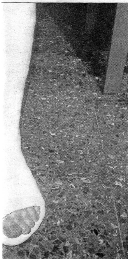
en un pie.

que confundieron estación de servicio del Vallès